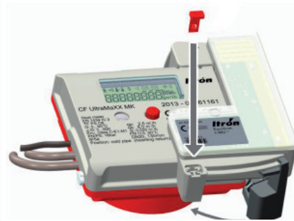
Verschließen und plombieren